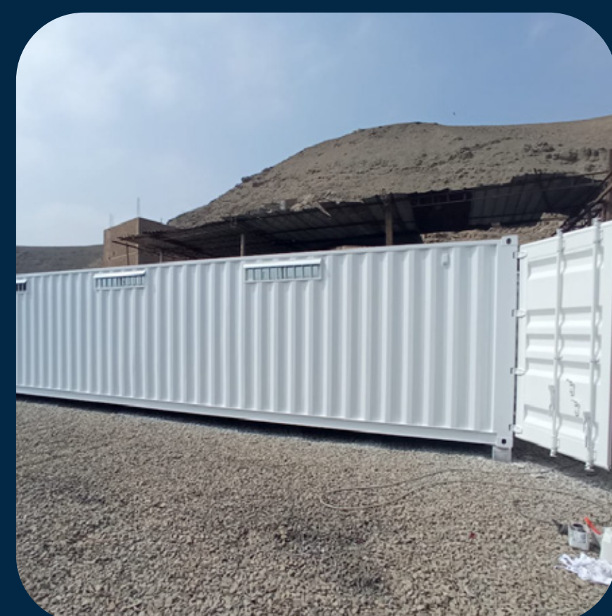
SALA DE REUNIONES