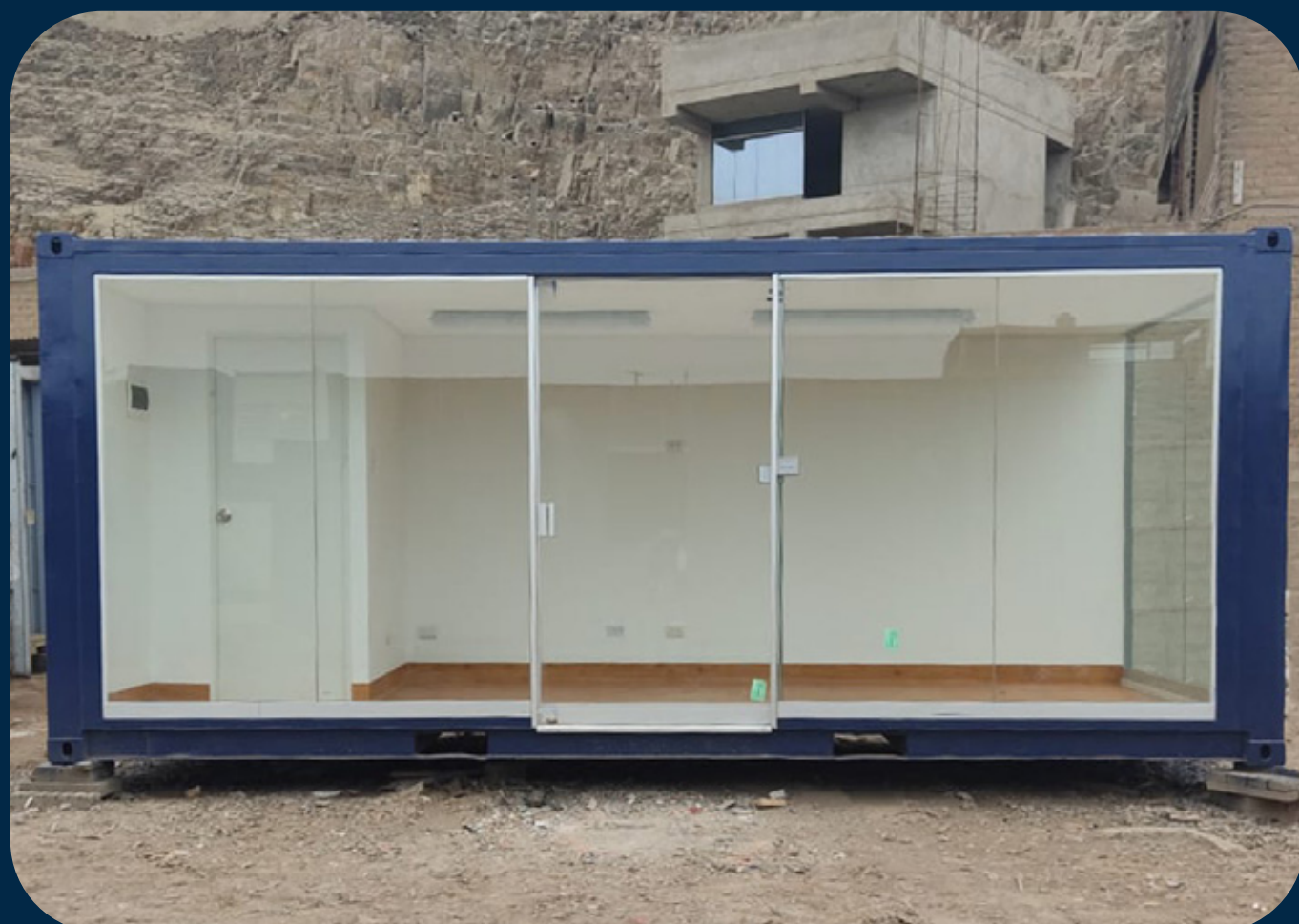
SALA DE VENTAS